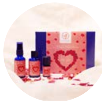
8254 For you Set