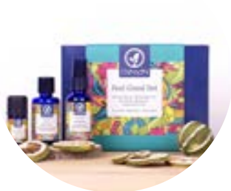
8252 Feel Good Set