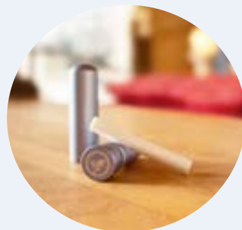
7066 Airome kék inhalátor stift