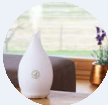
7063 Aroma Spa Ultrasonic diffúzor (Fehér)