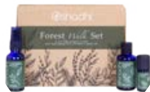
8253 Forest Walk Set