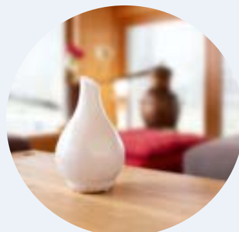
7064 Aroma Spa Ultrasonic diffúzor (Opál)