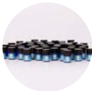
Essential Oil Tester Set