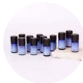
Eau de Toilette Tester Set