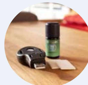
7085-5 Autós diffúzor Narancsos 5 ml illóolaj keverékkel