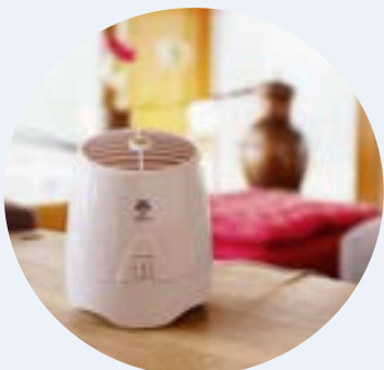
7060 Coolair Aroma diffúzor 230 V