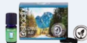
7080-5 Autós diffúzor klip Fókuszáló 5 ml illóolaj keverékkel