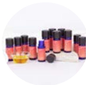
Carrier Oil Tester Set