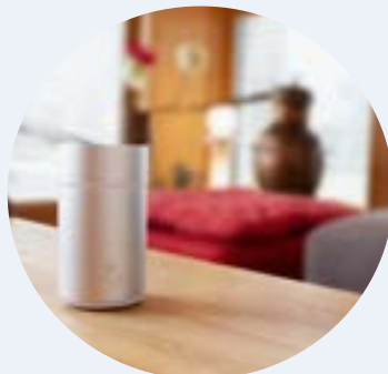
7018 Cool Breeze diffúzor